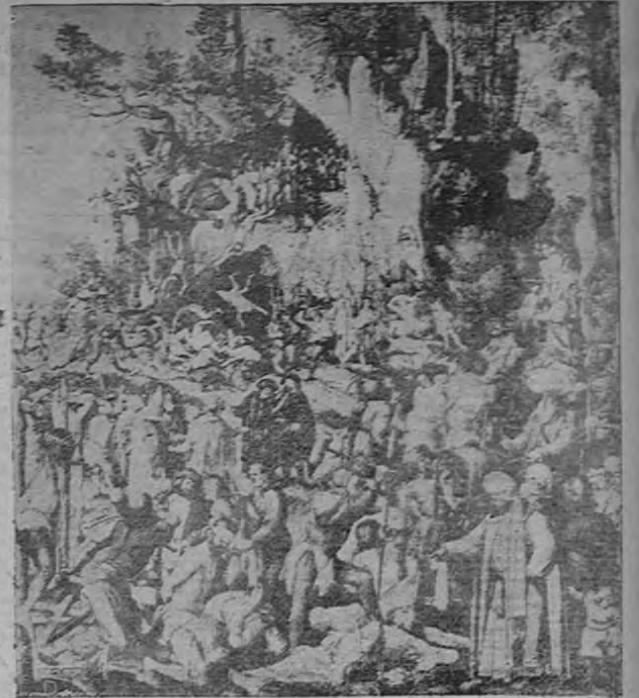
Arriba la famosa pintura de Albrecht Dürero, describiendo las primeras persecuciones de los Armenios por el Rey Sapor, monarca persa que trató atrozmente a los romanos.