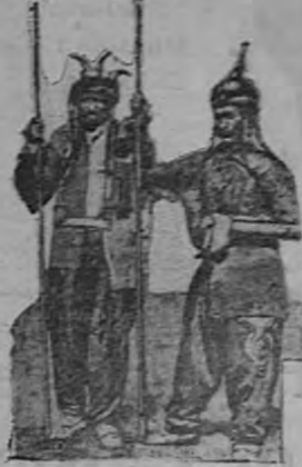
Arriba, dos soldados en babilonia de Damgham, la recién excavada ciudad de la Persia antigua, luciendo sus estrafalarias vestimentas usadas por sus sucesores hace miles de años.

Las Ruinas del Castillo de Belshazzar, Cuya Destrucción nos Narra la Biblia, Aparecen al Removerse la Tierra que Ocultaba a la Gran Ciudad